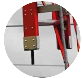
Sistema guía de acople de secciones