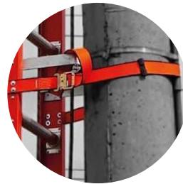
Lazo de amarre para fijación a poste

* Sujeción a poste en cuerdas y a pedido en reata.